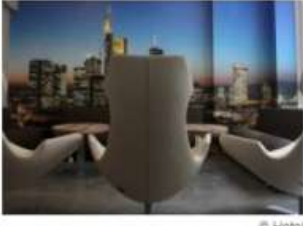
Die Lobby des neuen Smart Stay Hotels. Die Form der Sessel erinnert an einen äußerst erfolgreichen Mitbewerber

FRANKFURT/M. Die Münchner Hotelgruppe Smart Stay Hotels begrüßt jetzt auch Gäste auch in der Mainmetropole. Das Smart Stay Hotel Frankfurt ist ein Low-Budget-Hotel und liegt in der Niddastraße unweit des Hauptbahnhofs. Das Hotel Frankfurt erstreckt sich über sieben Etagen und verfügt über 100 modern eingerichtete Zimmer. Das Low-Budget-Haus bietet Einzel-, Doppel- und Mehrbettzimmer mit jeweils vier, sechs oder acht Betten an.